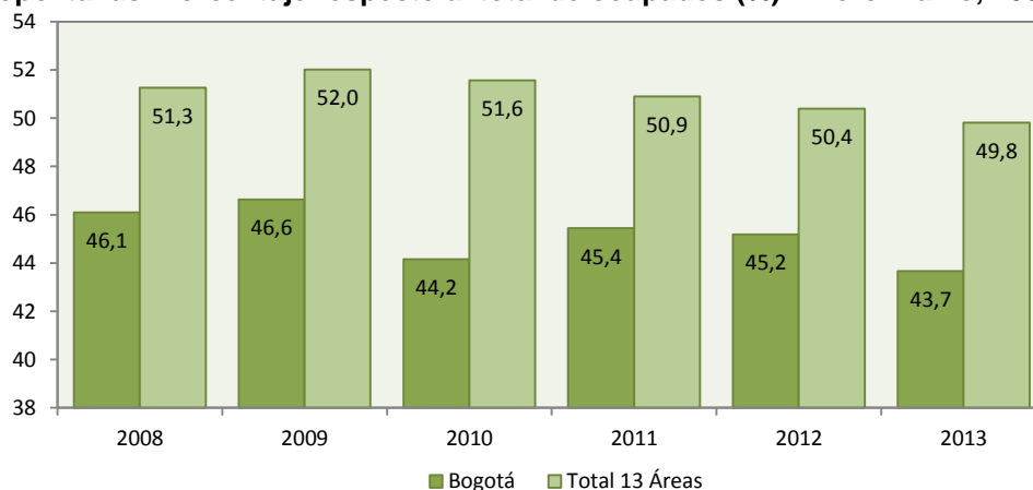
Gráfica 1. Tasa de informalidad laboral en Bogotá y las trece principales áreas metropolitanas. Porcentaje respecto al total de ocupados (%). Enero-marzo, 2008-2013

Fuente: Gran Encuesta Integrada de Hogares, DANE.